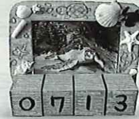
カメの万年カレンダー