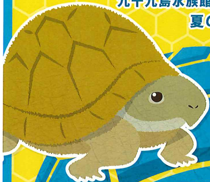
ヨツユビリクガメ