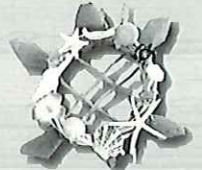
海のサマリーンス