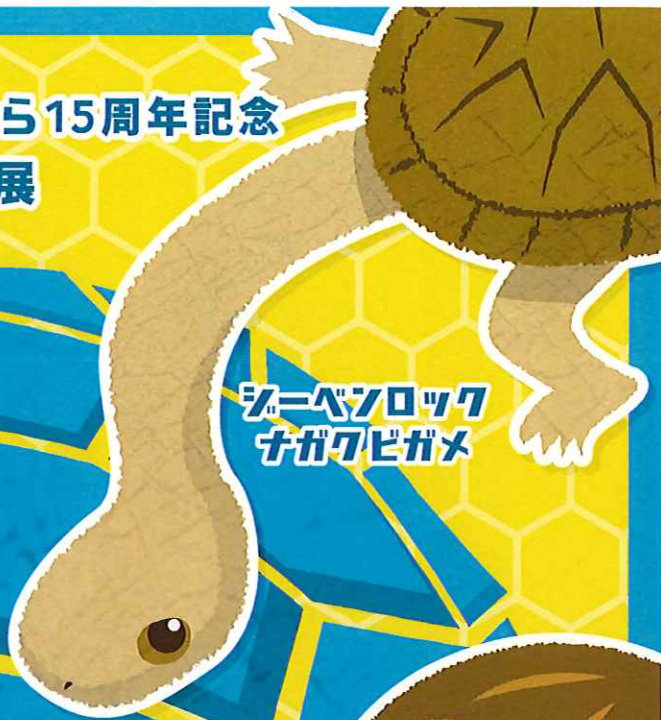
クニベノロック チガクビガメ